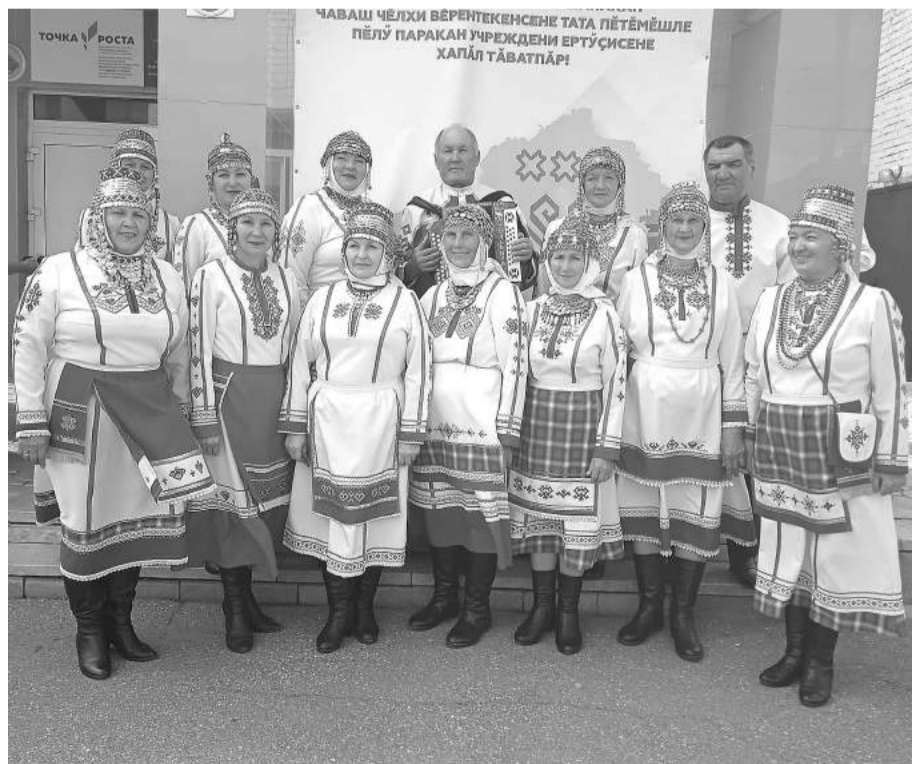
Выступает фольклорный ансамбль «Энэш».

Нам нравится жить в деревне. Люди строятся, возводят новые дома. Глядя на них, душа радуется, сердце наполняется гордостью за свою малую родину.